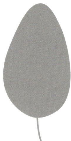
vejčitý ve tvaru vejce

Každý tvar listu obtáhni tužkou podle naznačených čar a pod list napiš, jaký je.